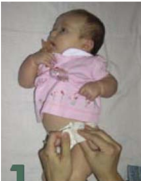
1 Cómo cambiarle el pañal

1. Alterne la posición de su bebé mientras le cambia el pañal, dándole la vuelta de un lado a otro y hablándole desde diferentes ángulos para animarle a girar la cabeza.