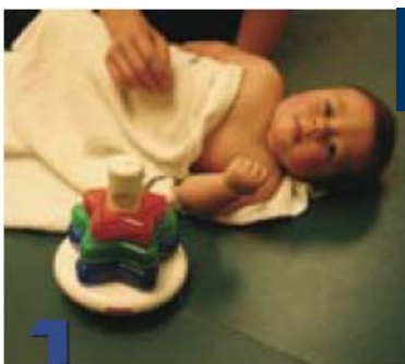
1 Cómo vestirlo y bañarlo

Mientras baña y viste a su bebé, también puede poner en práctica las medidas Tummy Time, de este modo se incrementa el tiempo que el bebé tiene para estar boca abajo: