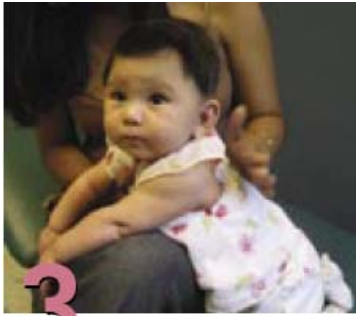
3 Cómo alimentarlo