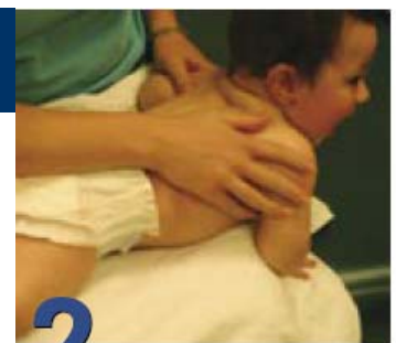
2 Cómo vestirlo y bañarlo