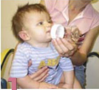
1 Cómo alimentarlo