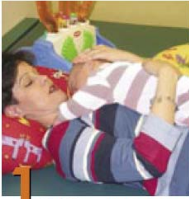
1 Posiciones para jugar