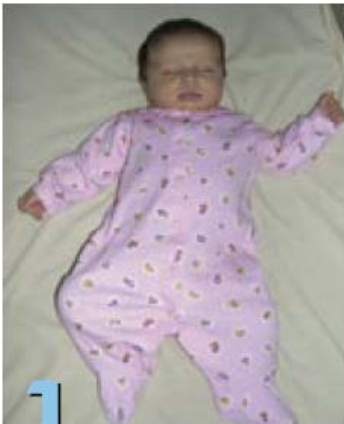
1 Para dormir