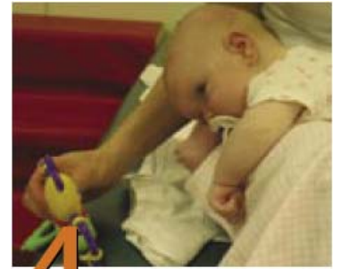
4 Posiciones para jugar