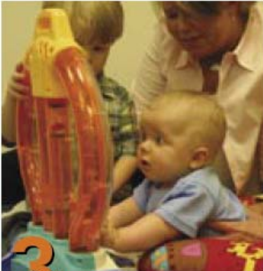
3 Posiciones para jugar