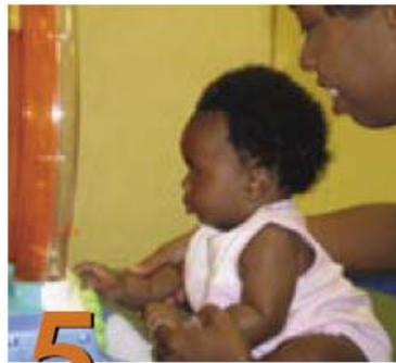
5 Posiciones para jugar