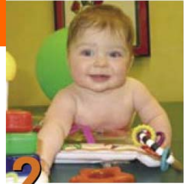
2 Posiciones para jugar