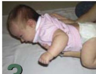
3 Cómo cambiarle el pañal