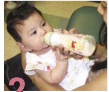
2 Cómo alimentarlo